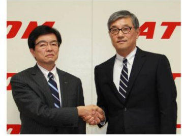
アトム運輸株式会社

コカ・コーラ社製品に特化した物流サービスを提供することによって、お取引先であるコカ・コーラボトリング会社にさまざまなかたちで貢献していきます。